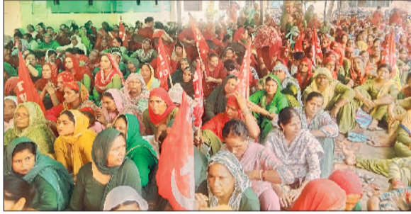
सिरसा। बिजली निगम कार्यालय में धरना देती आगनवाड़ी व आशा वर्कर और रोडवेज परिसर में हड़ताल पर बैठे कर्मचारी।

उनकी मांग है कि कौशल विकास के तहत लगे कर्मचारियों को पक्का किया जाए।