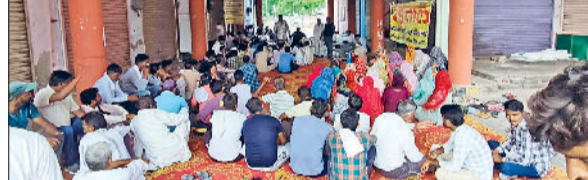
फतेहाबाद। हड़ताल कर नगरपरिषद कार्यालय में धरना देते कर्मचारी।

नगर पालिका कर्मचारी संघ हरियाणा व केन्द्रीय ट्रेड यूनियनों के आह्वान बुधवार को नगर परिषद फतेहाबाद के सभी कर्मचारी, ऑफिस स्टॉफ, सफाई कर्मचारी हड़ताल पर रहे। नगरपरिषद कर्मचारियों ने नगर परिषद प्रांगण में धरना दिया और सरकार के खिलाफ जमकर नारेबाजी कर अपना रोष व्यक्त किया। हड़ताल