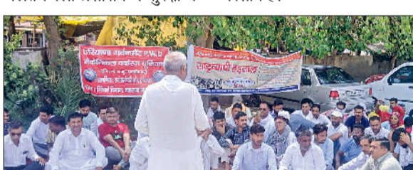
सिरसा। ऐलानबाद में धरना देते कर्मचारी तथा सुनसान पड़ा सिरसा का बस अड्डा।