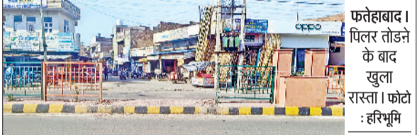
फतेहाबाद। पिलर तोड़ने के बाद खुला रास्ता।