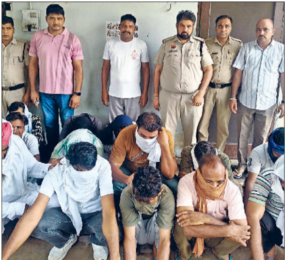
फतेहाबाद। फार्म हाऊस में जुआ खेलते पकड़े गए युवक।