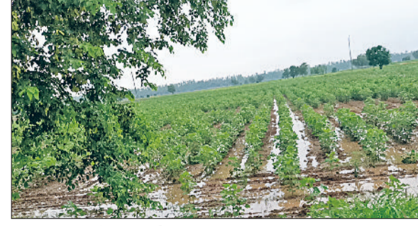
सिरसा। बरसात के बाद खिली नरमा फसल।